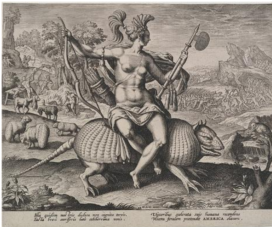
Figura 1. Alegoria dos Continentes, América. Marten de Vos & Adrieaen Collaert, Amsterdam (1600). Nela a figura de uma mulher ameríndia cavalga um tatu, como representação do exotismo da fauna do Novo Mundo.