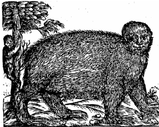
Figura 4. O “animal que come vento” de André Thevet, 1558. Além da postura terrestre de deslocamento, chama a atenção do desenho antropomórfico da face da preguiça representada.